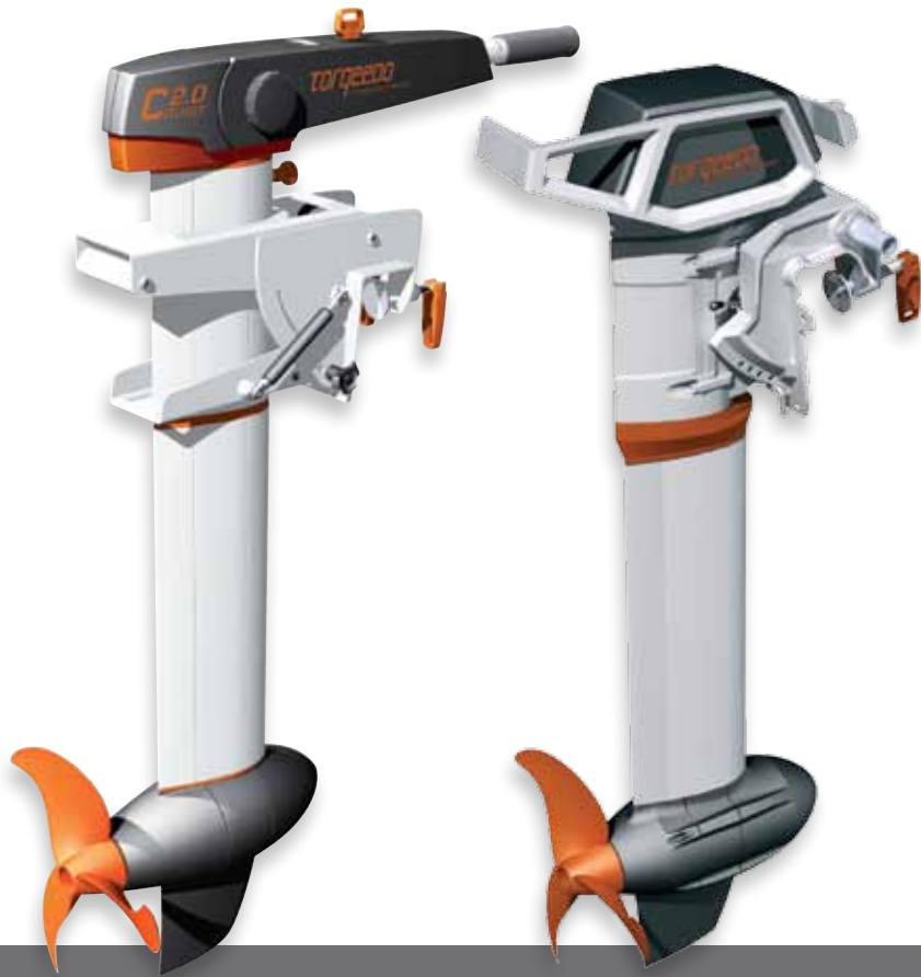
Torqeedo Cruise 2.0/4.0

Tavallisin lyijy- tai geeliakuin käytettävä sähköperämoottori, jossa erinomainen hyötysuhde.