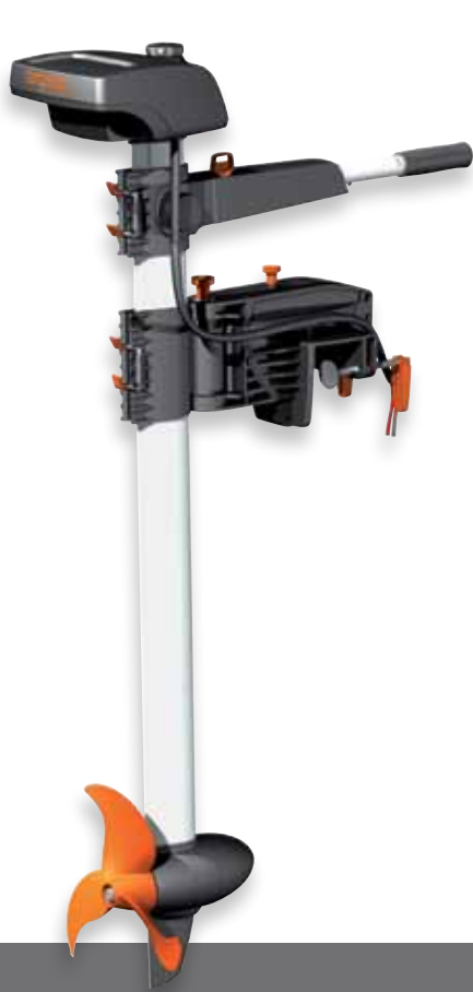
Torqeedo BaseTravel 401/801